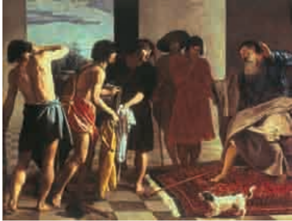
2. Velázquez, The Tunic of Joseph , 1630. Oil on canvas, 217 x 285 cm. El Escorial, Monastery of San Lorenzo.