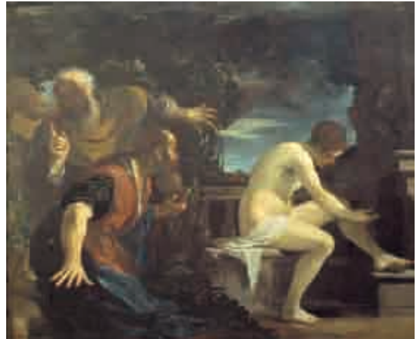
5. Guercino, Susanna and the Elders , 1617. Oil on canvas, 175 x 207 cm. Madrid, Museo del Prado.