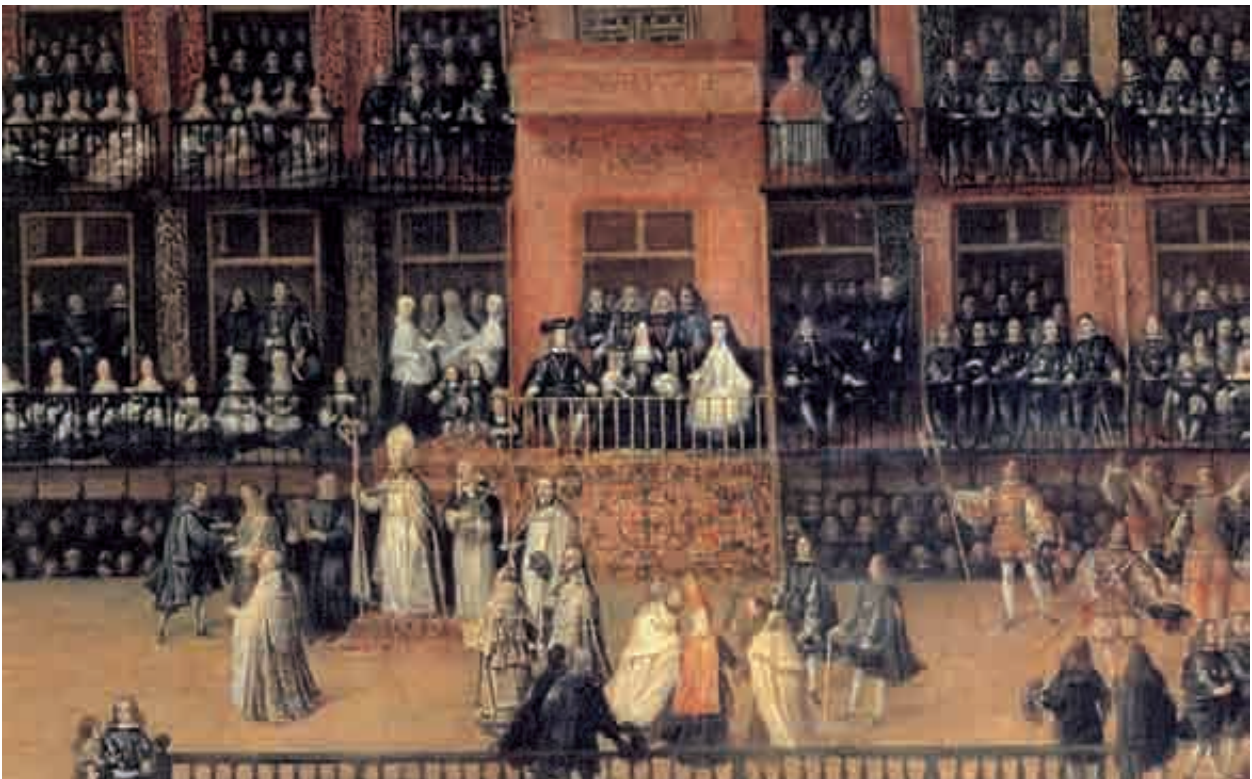
4. Francisco Rizi, Auto de Fe en la Plaza Mayor de Madrid , 1683. Detalle. Óleo sobre lienzo, 277 x 438 cm. Madrid, Museo del Prado.

variabilmente figura un enano. Precisamente durante la minoridad de Carlos II, el Rey niño suele aparecer detrás de su madre la Regente o de su hermana Margarita rodeado de un cortejo de ayas en las que no falta un personajillo de talla pareja a la del pequeño. Juan Bautista Martínez del Mazo en sus retratos de Mariana de Austria viuda (Londres, National Gallery, y Toledo, Museo del Greco) y de la enlutada Emperatriz Margarita de Austria (Madrid, Museo del Prado), incorpora en ambos a un enano a la comitiva mujeril que atiende al frágil Carlos. Pero su asistencia no se limitaba al recinto palatino, pues acompañaban al Rey también en actos públicos. Francisco Rizi en su gran cuadro del Auto de Fe de 1680 (Museo del Prado, Madrid; fig. 4) incluye hasta tres enanos a la derecha del estrado real, ocupando un lugar preferente en la complicada función celebrada en la Plaza Mayor de la capital, inmediato al espacio del soberano 10 .