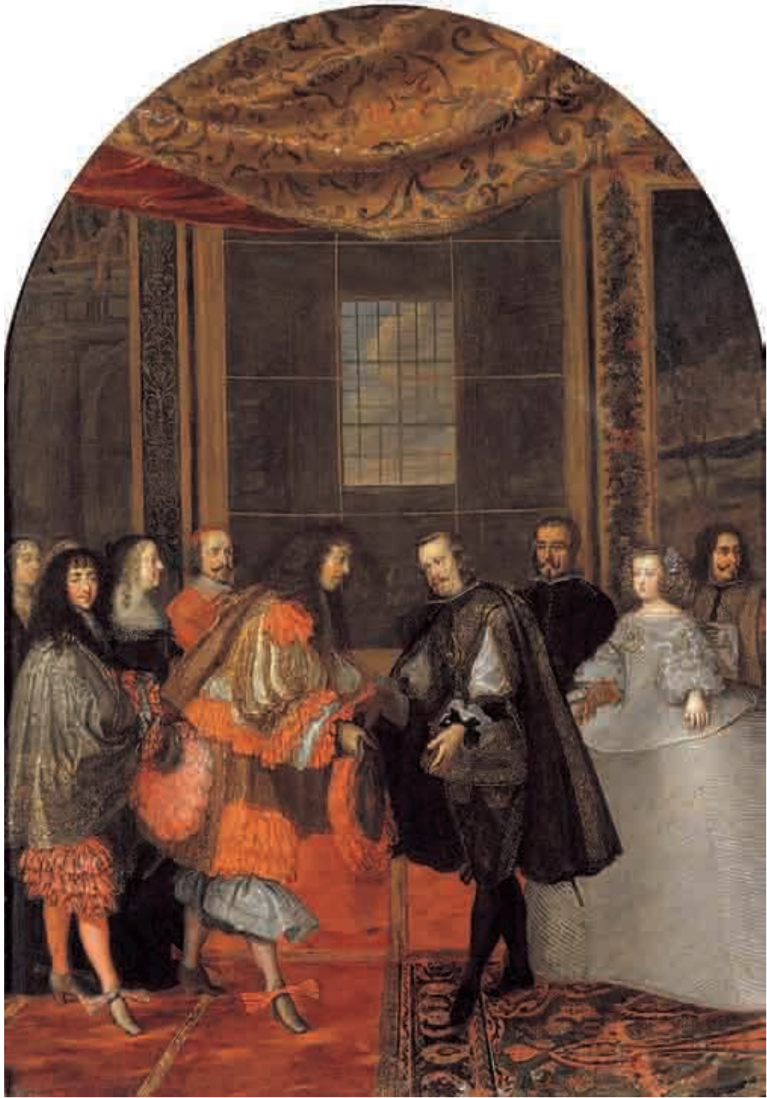
7. Adam Frans van der Meulen según un dibujo de Charles Le Brun, Entrevista de Luis XIV con Felipe IV en la isla de los Faïsanes . Óleo sobre cobre, 56,5 x 39,7 cm. Londres, Colección particular.