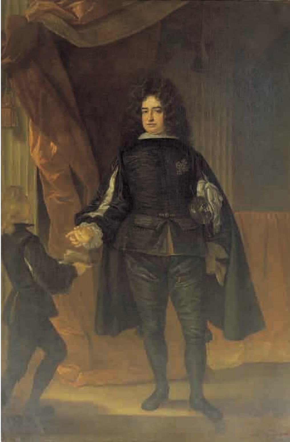
1. John Closterman, Alexander Stanhope , 1698-1699. Óleo sobre lienzo, 231,2 x 640 cm. Kent, The Administrative Trustees of the Chevening Estate.