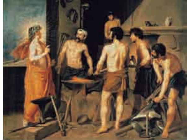
3. Velázquez, The Forge of Vulcan , 1630. Oil on canvas, 223 x 290 cm. Madrid, Museo del Prado.

sions, or affetti , that Velázquez obviously studied in the works of Tintoretto, Rubens, Poussin, and his Italian contemporaries in the intellectually fertile Rome of 1630. 6 As regards Guercino, however, what needs to be considered in greater detail is the disposition of the entire tableau as a central preoccupation of the Emilian artist, and subsequently, of Velázquez.