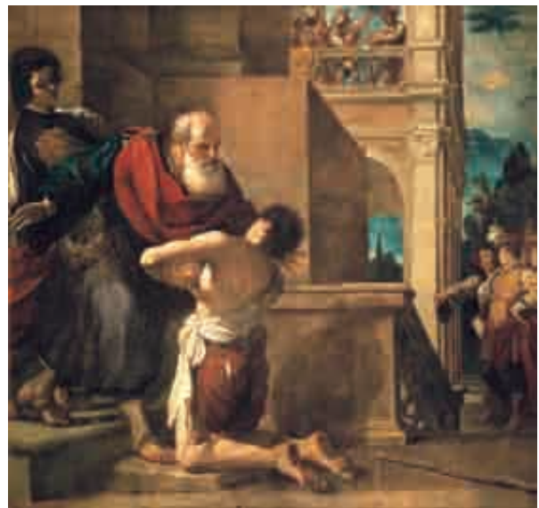
6. Guercino, The Return of the Prodigal Son , 1617. Oil on canvas, 192 x 203 cm. Turin, Galleria Sabauda.

later election as Pope Gregory XV brought Guercino to Rome in 1621. In 1664, his nephew Prince Niccolò Ludovisi bequeathed the paintings to Philip IV, whose admiration of the paintings must have mirrored that of his court painter. Another Ludovisi commission, the Return of the Prodigal Son (fig. 6) now in Turin, has also been cited as an important point of departure for Velázquez's Tunic of Joseph . However important