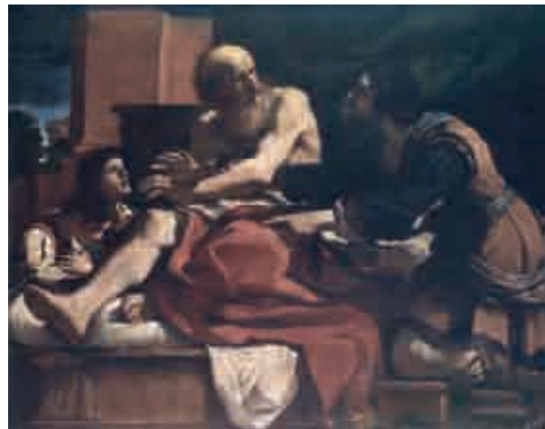
4. Guercino, Jacob Blessing the Sons of Joseph , 1620. Oil on canvas, 170 x 211.5 cm. London, Collection of Sir Denis Mahon.