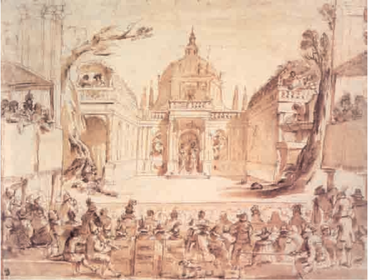
7. Guercino, Theatrical Production , before 1621. Drawing, pen and brown ink and brown wash, 36 x 46.5 cm. London, British Museum.

ence, from instruction to delight, was particularly important for painters. It is in this context that one can begin to historicize what has been loosely called «Baroque spectacle». 14