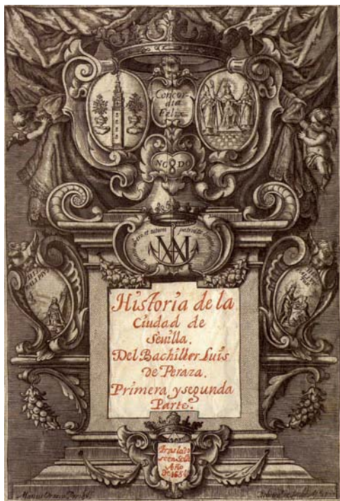
5. Portada de Historia de la ciudad de Sevilla , de Luis de Peraza. Copia manuscrita de 1684. Sevilla, Biblioteca Capitular y Colombina.

Como veremos más adelante, el paradigma de sevillano del Renacimiento que trazará Pedro de Medina en su Libro de la Verdad concuerda en muchos de sus rasgos fundamentales con esos genoveses «de vida regalada» descritos por Peraza. El mismo cronista, por otra parte, supo ver claramente la transformación que se operaba en su ciudad y dedicó al tema numerosos capítulos de su obra con elocuentes encabezamientos: «De las innumerables casas muy grandes y muy ricamente labradas que ay en la magnificentísima cibdad de Sevilla» (libro XIII, cap. 9); «De la onestidad de personas y trajes de los cibdadanos de Sevilla» (libro XIII, cap. 13); «De la abundancia de pan, vinos, carnes, aves, peces, y diversidad de frutos que solamente se venden en Sevilla» (libro XIV, cap. 8); «De la anchura y alegría de las sevillanas calles» (libro XIV, cap. 6), etcétera.