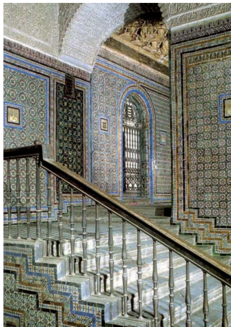
15. Escalera de la Casa de Pilatos con azulejos de los hermanos Polido y escudos alternados de los Enríquez y los Ribera. 1538.

De este modo, con Pilatos y las Dueñas y con otros palacios familiares hoy desaparecidos o profundamente transformados 40 los Enríquez de Ribera ayudaron a crear un tipo de casa sevillana síntesis de lo que podríamos denominar «gótico-mudéjar» y de lo renacentista, una materialización, en definitiva, de tres tendencias contrapuestas: la voluntad de renovación, la pervivencia de la tradición y las capacidades tecnológicas y constructivas locales.