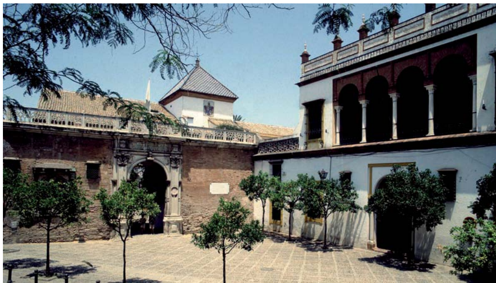
9. Fachada en ángulo de la Casa de Pilatos. Sevilla.

dio punto flanqueado por pilastras corintias, constituye una adaptación del arco triunfal clásico (fig. 10), y en sus enjutas incorpora medallones de emperadores romanos muy próximos a los tallados por el mismo taller genovés en la fachada de la Cartuja de Pavía 32 (figs. 11, 12); pero a tal «declaración de principios» classicista encontramos superpuestas las cruces recrucetadas de Jerusalén, inscripciones alusivas a la peregrinación que el marqués de Tarifa realizó por Tierra Santa en 1519-1520, citas bíblicas y, como culminación, la calada tracería gótica de la balaustrada 33 . Tradición e innovación, pues, fundidas en una unidad ideal que, como en tantos otros aspectos, iría revelándose peligrosamente inestable con el paso de los años.