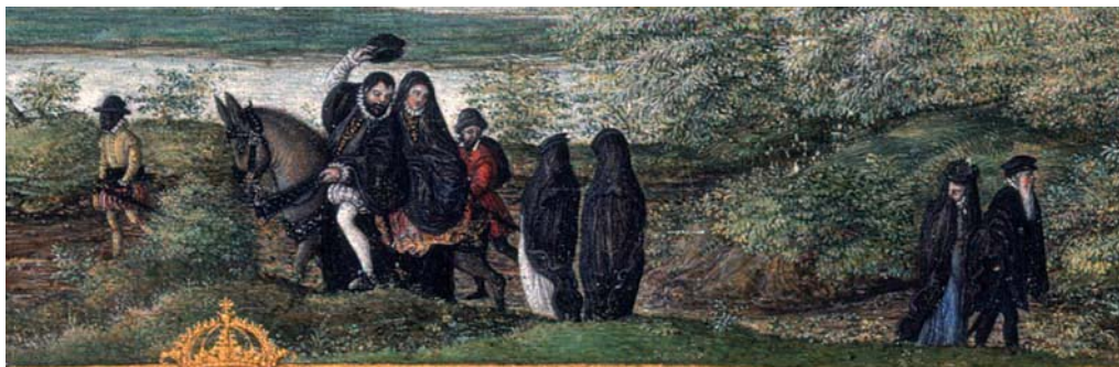
6. Joris Hoefnagel, Vista de Sevilla (detalle de personas de calidad). 1573. Gouache sobre pergamino, 216 x 323 mm. Bruselas, Bibliothèque royale de Belgique Albert I er .

Pero si así iban vestidos los sevillanos hasta del «más baxo oficio», qué puede decirse, como se pregunta retóricamente Peraza, «de la onestidad de las nobilísimas sevillanas»: