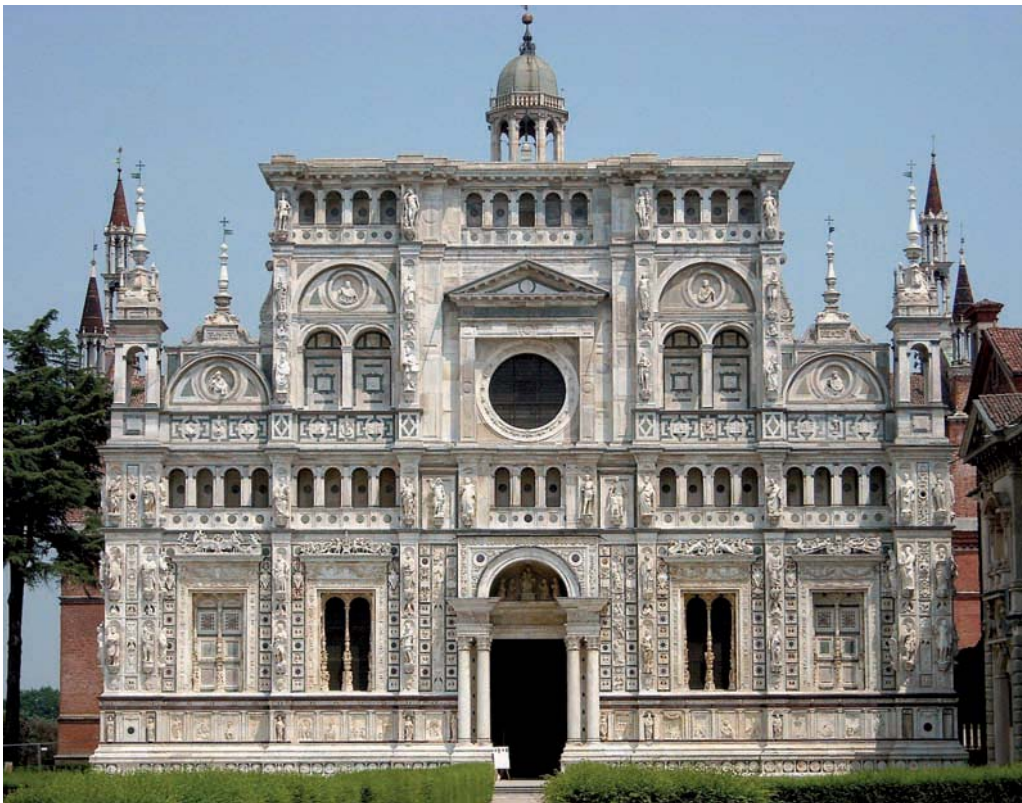
12. Cartuja de Pavía, de Filippo Mantegazza, Giovanni Antonio Amadeo y otros. Comenzada en 1473.