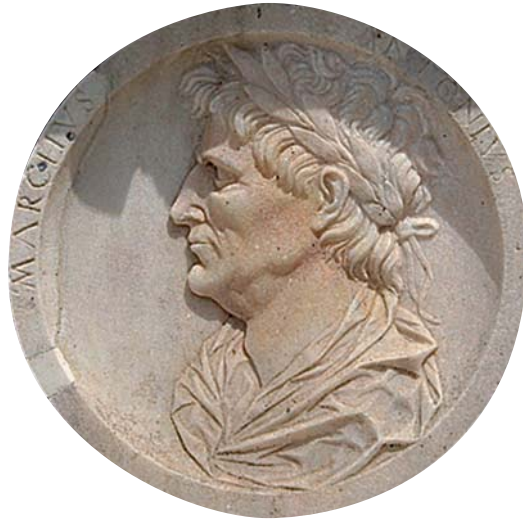
11. Medallón del zócalo de la fachada de la cartuja de Pavía.