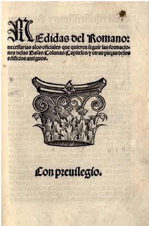
3. Portada xilográfica de Medidas del romano (Toledo, Ramón de Petras, 1526, in-4º), de Diego de Sagredo. Madrid, Biblioteca del Colegio de Arquitectos de Madrid (COAM).

También Sagredo, en la Dedicatoria a don Alonso de Fonseca y Ulloa (1475-1534), arzobispo de Toledo y canciller mayor de Castilla (fig. 4), subraya con denodado ímpetu la extraordinaria importancia de su empresa editorial; ésta se cifra por un lado en la necesidad de divulgar el legado de Vitruvio y de «otros antiguos que en la ciencia de arquitectura largamente escribieron», a fin de instruir a los oficiales españoles y evitar los muchos errores que se cometían cada día al amparo de la ignorancia; por otro, se cifra en la aplicación intelectual y las largas jornadas de estudio que tuvo que invertir Sagredo para lograr su objetivo mediante un breve y divulgativo diálogo 5 . Así lo señalaron ya Marías y Bustamante, explicando además que la segunda justificación del autor se basaba