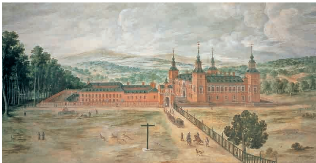
36. Anónimo madrileño, Vista del Pardo . Siglo XVII. Óleo sobre lienzo, 137 x 278 cm. Madrid, Real Monasterio de San Lorenzo de El Escorial. Patrimonio Nacional.

en mano, conforme a las trazas generales y particulares que de ello están hechas» 7 . Por trazas generales o maestras hemos de entender aquellas que definen el proyecto de arquitectura, mientras que las particulares son aquellas otras –de carácter más concreto– que se usan para la ejecución del proyecto, durante el proceso constructivo (fig. 37).