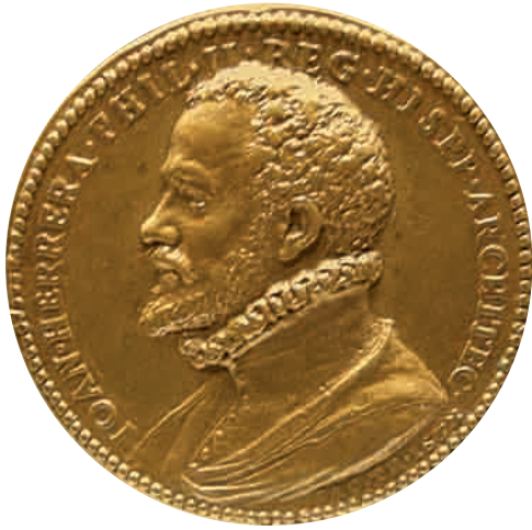
38. Jacopo da Trezzo, Juan de Herrera . 1578. Medalla de bronce, 50 mm de diámetro. Madrid, Museo Arqueológico Nacional.

la organización y el mando. Según Bustamante, estas cualidades le permitieron «ganarse la confianza de Felipe II, y acabar dominando las obras como Arquitecto de Su Majestad sin necesidad de ninguna maestría mayor». Por lo que atañe a El Escorial, ésta se suprimió oficialmente mediante la Instrucción particular de 1572, así que