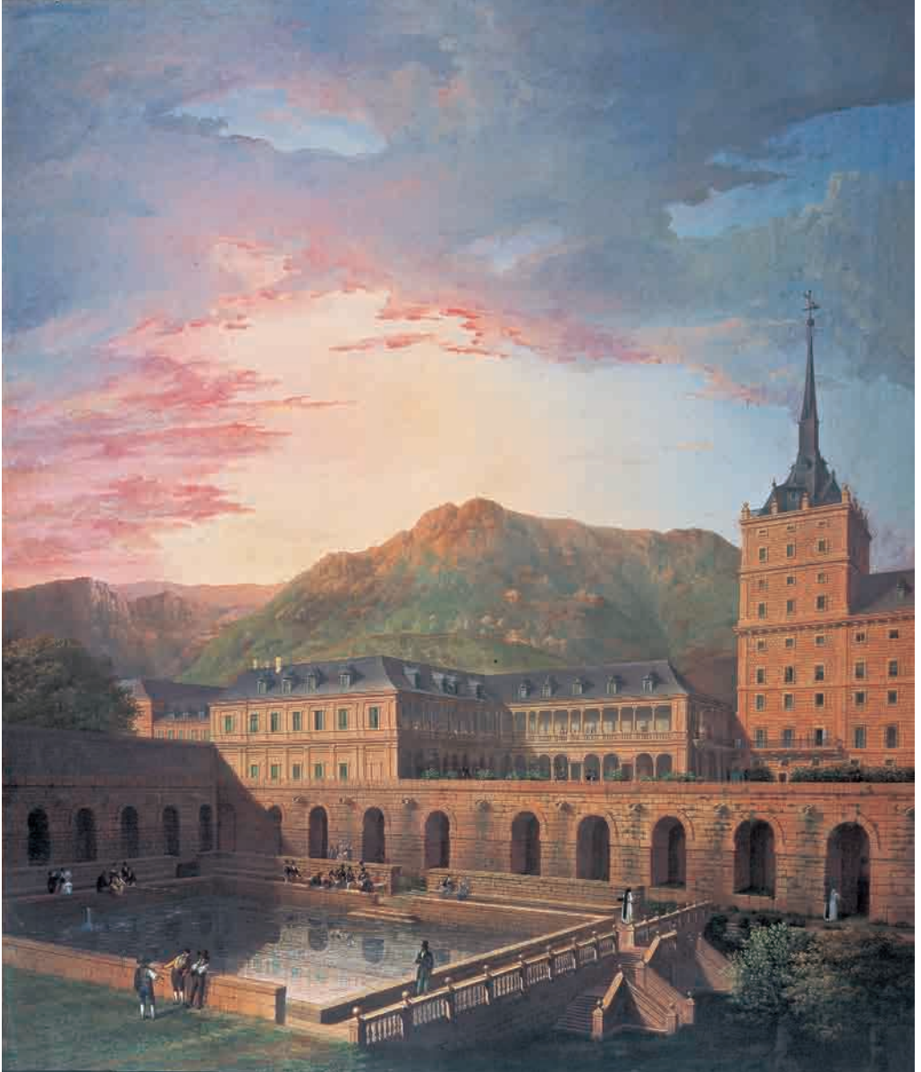
40. Fernando Brambilla, Vista de la Galería de Convalecencia y estanque de recreo de los monjes del Real Monasterio de San Lorenzo . Primer tercio del siglo XIX. Óleo sobre lienzo, 165 x 139 cm. Patrimonio Nacional.