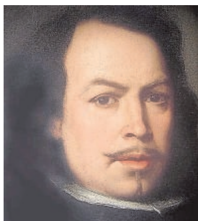
Autorretrato de Bartolomé Esteban Murillo