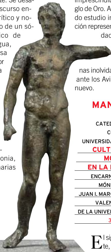
Escultura de ALEJANDRO MAGNO, bronce, siglo IV a.C., París, Museo del Louvre.

Libro de amena lectura y contenido muy personal acerca de Alejandro Magno, un personaje decisivo y fascinante. Se desarrolla en un discurso enriquecedor, crítico y novedoso, propio de un sólido catedrático de Historia Antigua, que se expresa como el profesor que imparte a sus alumnos (lectores) las lecciones de una asignatura. En este caso, dedicada a Alejandro: su procedencia dinástica de Macedonia, sus extraordinarias