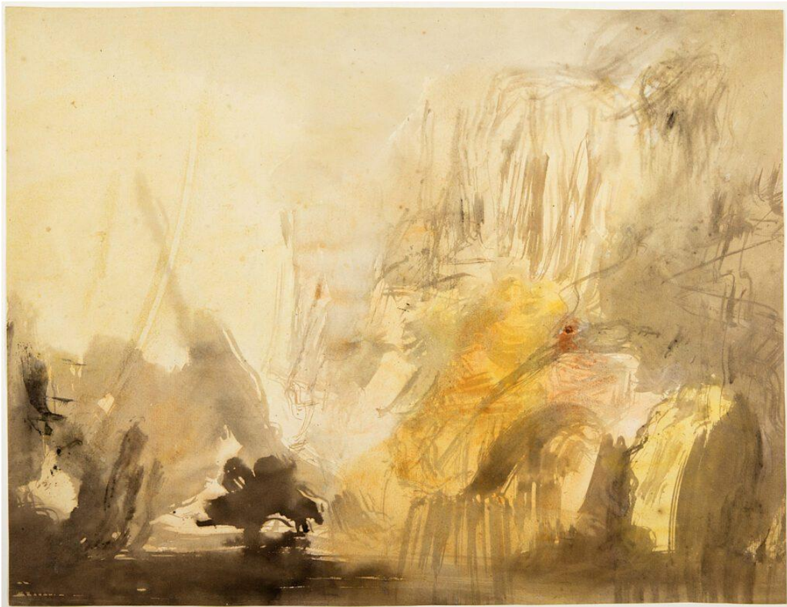
Eugenio Lucas, 'Acantilado'. 1850-1870. Aguada de tinta, acuarela y gouache sobre papel. Museo Lázaro Galdiano.