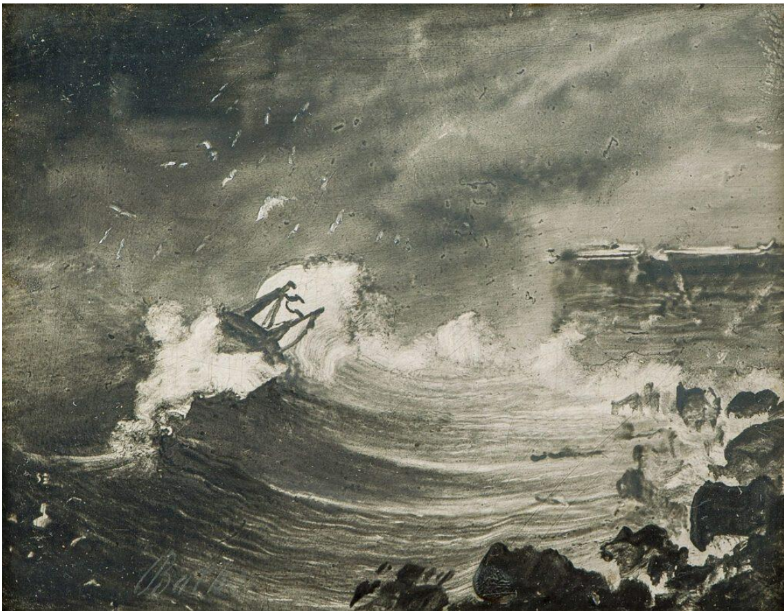
Peder Balke, 'Naufragio, Cabo Norte'. 1870-1880. Óleo sobre tabla. Oslo, The Gundersen Collection.

Visionarios románticos sitúa a los tres artistas en la tradición romántica visionaria –en sintonía con otros paisajistas del siglo XIX como Caspar David Friedrich, J.M.W. Turner o Victor Hugo– llevándola más allá, explorando por primera vez este fenómeno como algo transnacional y brindando al mismo tiempo una nueva comprensión de un capítulo poco estudiado en la historia del arte.