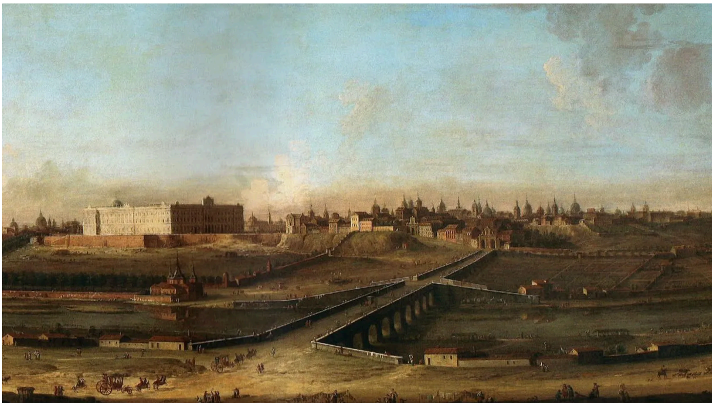
Vista de Madrid desde el puente de Segovia con el Palacio Real al fondo, por Antonio Joli (c.1753). / MUSEO NACIONAL DEL PRADO

Dos grabaciones recientes rescatan el esplendor musical del Madrid ilustrado, tanto en los templos como en las capillas aristocráticas