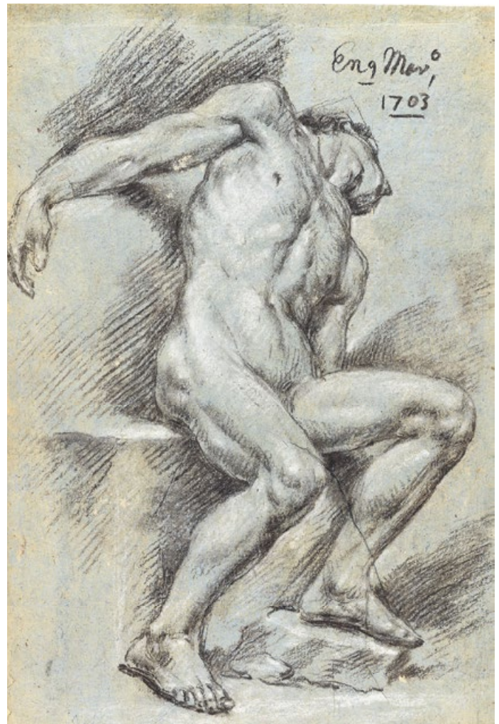
DE IZQUIERDA A DERECHA: Juan Conchillos. Vista de Paterna . 1690. Museo de Bellas Artes de Valencia [inv. 38]. Juan Conchillos. Hombre sentado con el cuerpo desplomado . 1703. Museo Nacional del Prado, Madrid. [inv. D121].