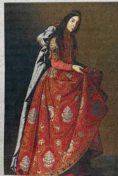
'Santa Casilda'

La obra más antigua presente en la muestra es una 'Crucifixión', de 1627, que estuvo dos siglos en la sacristía del monasterio de San Pablo el Real. Obra maestra de sus inicios, se advierte en ella la huella de Caravaggio y el claroscuro. No en vano le apodaron 'el Caravaggio español'. Es un préstamo del Art Institute de Chicago. Cuelgan obras maestras religiosas como 'San Serapio' (Wadsworth Athenaeum Museum of Art de Hartford) -su hábito es una