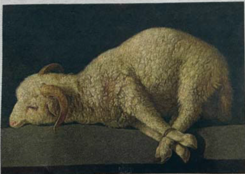
'Agnus Dei' (h. 1635-40), de Zurbarán.

Las últimas secciones se centran en sus obras de pequeño formato concebidas para devoción y contemplación privadas: 'Agnus Dei' (Prado) -una de sus pinturas más célebres, reproducidas y queridas por el público-, 'El paño de la Verónica' (Museo Nacional de Escultura de Valladolid) o 'La familia de la Virgen' (Colección Abelló). Zurbarán murió en Madrid, a los 65 años. Con permiso de Carlos III -de visita estos días en Estados Unidos-, el pintor se ha coronado en Gran Bretaña.